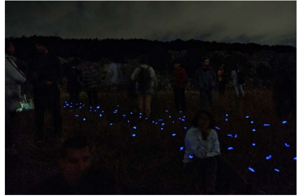
Bagliore - di Francesco Pacelli - passeggiata notturna

Diverse persone si sono commosse alla vista. L'opera è stata capace di smuovere qualcosa di profondo, attirando persone che, spinte dalla curiosità, hanno seguito la nostra carovana di macchine fino in cima alla montagna. È stato un momento magico che non dimenticheremo mai.