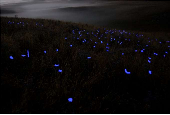
Bagliore - di Francesco Pacelli - dettaglio

L'installazione era composta da circa trecento piccoli oggetti piantati nel terreno come fossero fiori e cosparsi di pigmento fluorescente. Insieme formavano un'onda luminosa lunga una quindicina di metri, collocata in un ampio campo sulla sommità della montagna che si affaccia su Frosolone.